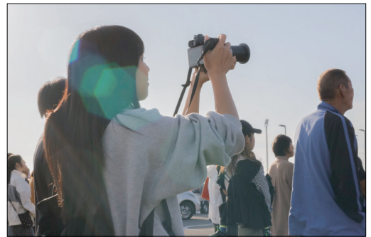
▲町内イベントでは情報発信用に積極的に取材を行った

ラッコをきっかけに浜中町を知ってくださった方に向けて、町内の飲食店や体験施設を巡っていただきたいと思っています。そこで、町内の各スポットにパンフレットを設置したり、事業者の皆様への取材を行い、より深く魅力を知れるコンテンツの開発を行いたいと思っています。それらの情報は、モデルコース開発などにも活用する予定です。町民の皆様のご協力を、どうぞよろしくお願いいたします。