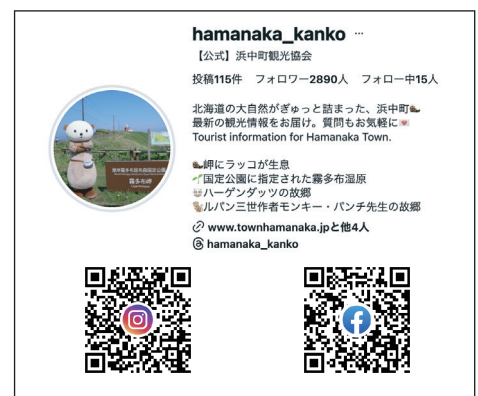
▲運用中の浜中町観光協会の SNS フォロワーが 2800 人を突破