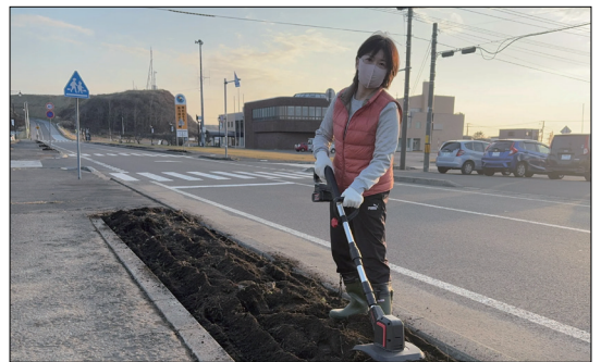
火防線の植栽柵整備の様子 (霧多布地区)▲▼