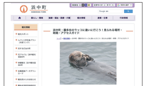
▲役場の HP に観光情報を掲載するなど検索エンジン向きの手法による発信も実施