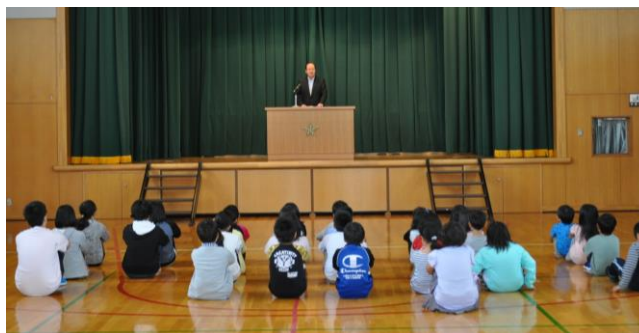
↑(校長先生の話聞いています)

8月21日(水)に行われた2学期始業式の様子です。姿勢良くしっかりと話をしている人を見えています。