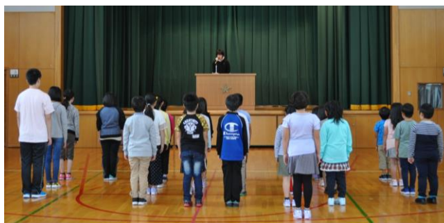
↑(児童会代表の話聞いています)