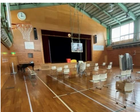
3/9～3/11 式場及び卒業生動き確認