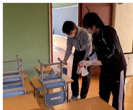
3/12 3/18 3/23 全校消毒作業