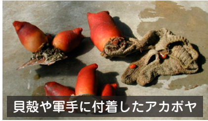
貝殻や軍手に付着したアカボヤ

北海道の太平洋側に生息しており、日本海側の水深50mほどの深みにも生息しています。主に根室で漁獲され、釧路やオホーツクでも漁獲されます。そのほとんどが道内で消費されています。9月～翌年1月頃まで産卵しますが、生息域の海水温が12～15℃となる10月下旬～11月中旬が産卵盛期とされています。産卵後数日でふ化し、幼生となり、2日程度で形状が丸くなり付着します。付着するものは特に決まっておらず、貝殻や軍手、空き缶、ロープなど何にでも付着します。