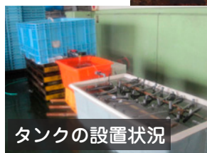
タンクの設置状況