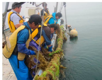
作業状況（沖出し作業でのしに垂下する）

技術普及指導所・浜中町が事業化に向け取り組んでいます。現在は人工採苗、中間育成までは成功しておりますが、本養成の段階で斃死している状況です。そこで斃死の要因として考えられる垂下ロープへの雑物の付着を防ぐために、ロープの長さを伸ばし、飼育に適する水深を調査しています。