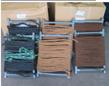
採苗器（ロープに幼生を付着させる）