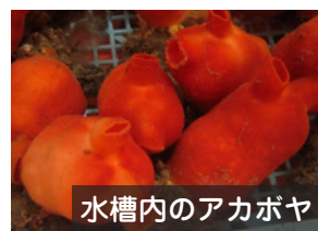
水槽内のアカボヤ

する技術を開発することを目的に取り組んでいます。浜中町では10月中旬～11月に親ボヤを採取し、産卵の適水温である12℃前後を維持し産卵させ、ロープへの付着確認をした後に沖出しして飼育します。