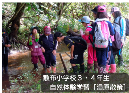
散布小学校3・4年生 自然体験学習 [湿原散策]

今後も、子どもたちが、ふるさと浜中を誇りに思うことができる教育を活性化していきます。