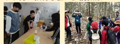
↑6年 サイエンスルーム(釧路)