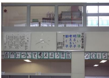
環境宣言周知ポスター

茶内第一小学校の環境活動宣言である「自然について考えよう宣言」を児童及び教職員、来校者にわかりやすく掲示されていました。また、低学年でもわかりやすいように児童会で活動の作戦名を考え、環境保全活動に参加しやすい体制が取られていました。活動のチェック体制に関しては、活動の振り返り用紙を作成し、それを毎月記入することで意識を高めていました。また、茶内第一小学校では「くるみっこ緑の少年団」として、学校周辺の植林及び浜中町植樹祭等へ積極的に参加し、自然保護活動を行っています。