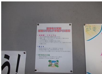
環境宣言周知ポスター

霧多布小学校では「環境にやさしい学校づくり宣言」とそれに関わる行動指針が書かれたポスターを掲示し、周知していました。さらに、ISO 周知ポスターを自作し、掲示することで意識付けを行っていました。また、ごみの分別に関しては、自作ポスターの掲示やゴミ箱に大きく「もえるゴミ」、「プラスチック資源」等の張り紙を行っていました。戸締まりの徹底、使用していない電気の消灯等の節電活動も行っており、環境にやさしい学校づくりを実践していました。