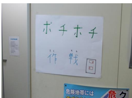
節電周知ポスター