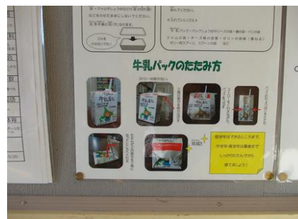
牛乳パックの処理方法