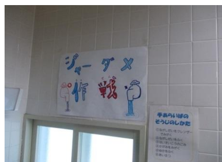
節水周知ポスター