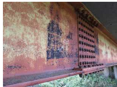
登別橋(橋長22.46m) 昭和47年供用開始(51歳)