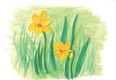
●町の花【えぞかんぞう】