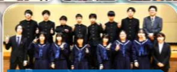
2年生(演劇)「シンキング・デッド」 ★学校中の人々がゾンビになった。だけど明日は合唱コンクール! このまま3人の青春は終わってしまうのか!