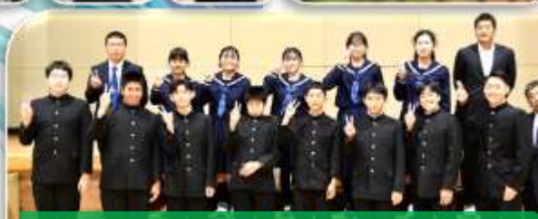
3年生(演劇)「なんてこった!!6人の野望」 ★2023年隕石が接近中…。このままでは地球崩壊の危機。それを止めるべくして各国から6人の科学者が選ばれたのだが…。