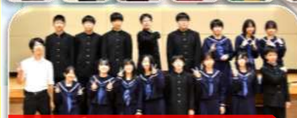
1年生(演劇)「はやおのある出来事」 ★はやおが摩訶不思議な世界に入り込み体験したことは…。 ★「オタ芸&ダンス」~「Super shy」「愛を伝えたいだとか」「アスノヨゾラ哨戒班」~